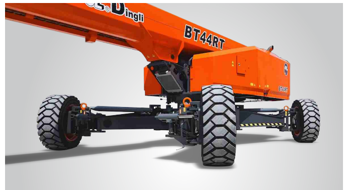
Nouvelle technologie brevetée d'extension des essieux "in situ"