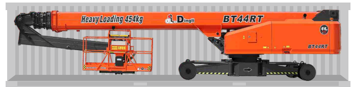
Transport par container standard